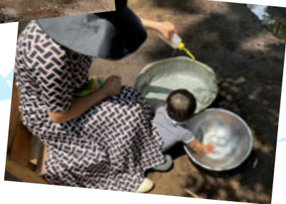
初めての 水あそび