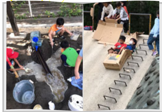
砂場はいつも大人気

小さな砂場では、雨樋やバケツやじょうごを使って、水は通るけど、砂はとおらない装置が作られたり、色んな実験がうまれます。はじめての水遊びは、水がこぼれ落ちること、ザーという音、消えてなくなる様子を楽しむことから。大人になったら、当たり前すぎて見落とすような小さな事に、ワクワクしている様子が見られます。生きるチカラを育てる瞬間です！そんな素敵な瞬間をじっくり見ることができます。小学生のお兄さんお姉さんたちは、少しの仕掛けでドンドン名もなきあそびを生み出しています。雨の日だって、廃材で作った船や、絵の具を使って水の流れを観察したり、大きなブルーシートを屋根にして、雨の日ランチを楽しんだり♪