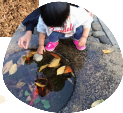
いろいろな色の 葉っぱも 楽しめる!