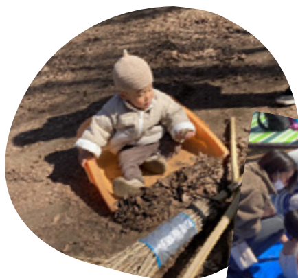
すっぽりとおさまって♡ みんなで愛でした

「そとぼ〜よ！」は出入り自由です。何をしても過ごしてもいいんですよ。“みんなで作る親子ひろば”なのでやってみたいことがあったら気軽に相談してくださいね。一緒にどうやったらできるか考えましょう。子どもにとってだけじゃなく、パパやママにも居心地のいい場所でありたいと思っています。頑張らなくてもいい場所です。困ったこと、うれしいことがあったらお話しに来てくださいね。(川越沙江)