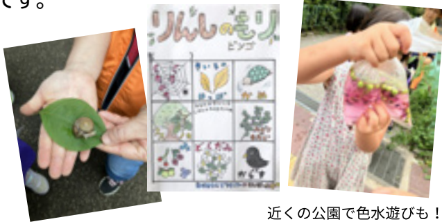
近くの公園で色水遊びも！

そとぼーよと中原児童センターのコラボ企画 「中原あそぼーよ！」を開催しました。 林試の森でネイチャービンゴやかくれんぼをして自然を感じながらあそびました。今後も定期的に関催する予定です。