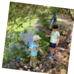
八潮さんぽのザリガニ釣り！ 大漁でした！

挽きたてのコーヒーで一息ついたり、おしゃれな環境で思いきり遊べたりするのも『みんなでつくるアソビバ』ならではのでした！