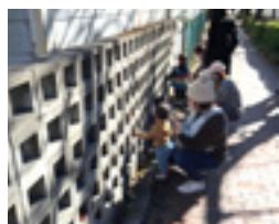
大崎目黒川沿いのブロック塀 いろいろ入れてみよう！