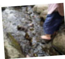
戸越公園にて つめたくて気持ちいい！