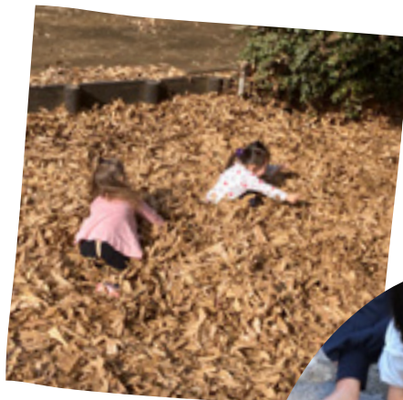
落ち葉がたっぷり! 文庫の森最高!